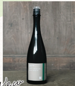
New Maison Aoi Farmer 大川戸 越淡麗