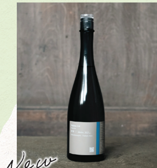
New Maison Aoi Farmer 新保(しんぼ) 五百万石