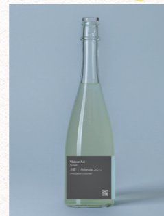
Maison Aoi 水縹(みはなだ)